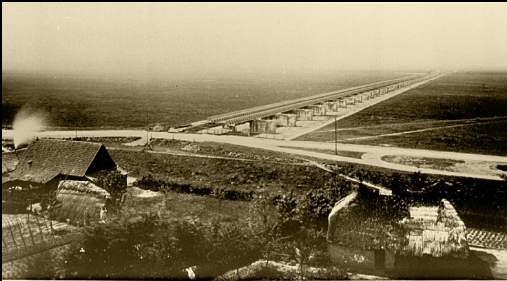
DOORLAATBRUG OVER DEN BAARDWIJKSCHEN OVERLAAT.