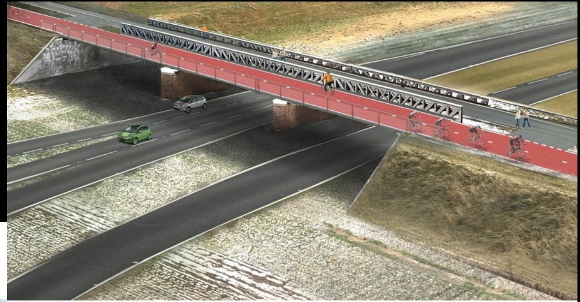
Brug over de afslag naar de A59 met schets van de nieuw aan te leggen brug voor snelfietsroute