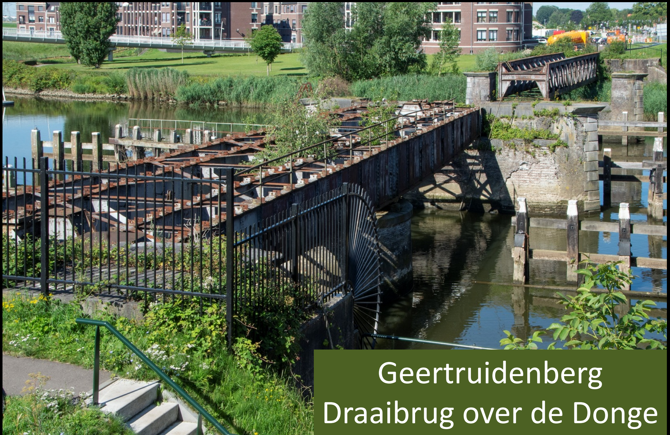
Geertruidenberg Draaibrug over de Donge