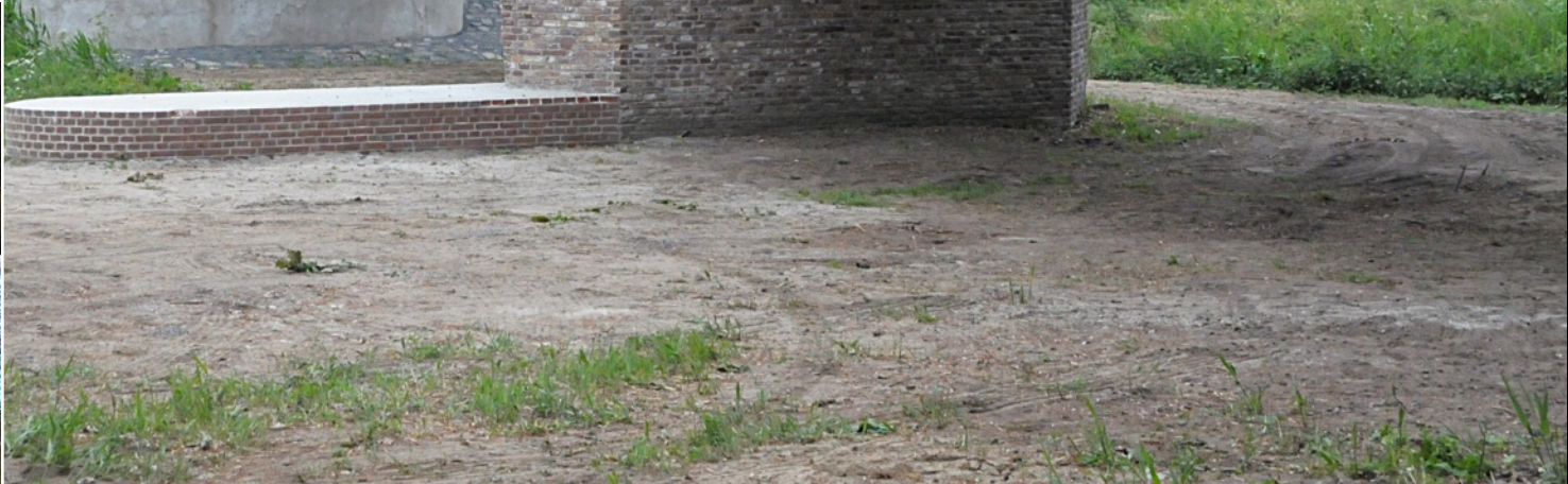
Venkantbrug bij Vlijmen