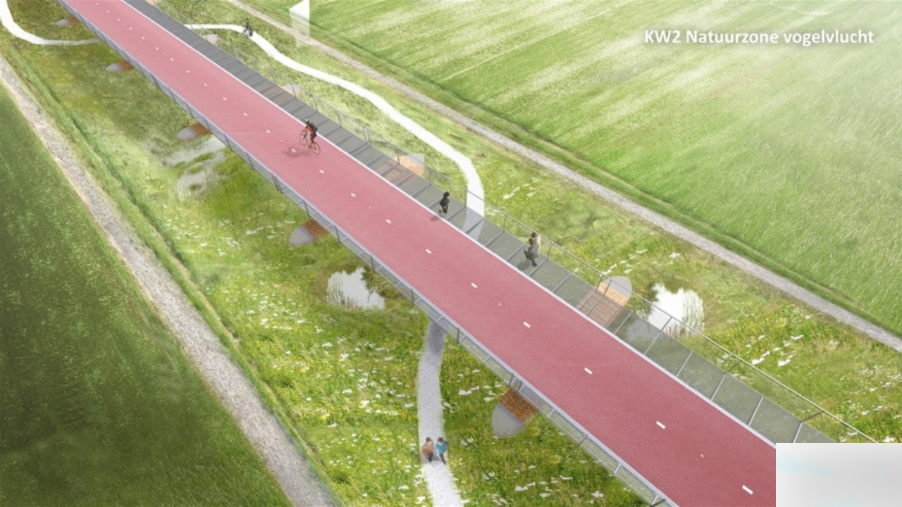
KW2 Natuurzone vogelvlucht