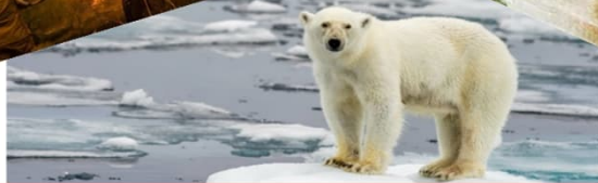
Klimaat, CO 2