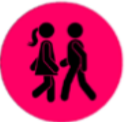
Bewegend en ontmoetend Amersfoort